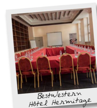
BestWestern Hôtel Hermitage

Après la réunion, il est l'heure de prendre un bon bol d'air frais... Voici nos incontournables, sélectionnés spécialement pour vous ➤