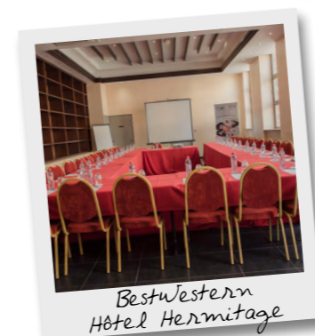
BestWestern Hôtel Hermitage

Après la réunion, il est l'heure de prendre un bon bol d'air frais... Voici nos incontournables, sélectionnés spécialement pour vous ➤