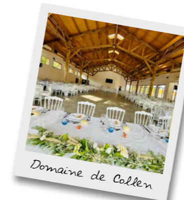
Domaine de Collen