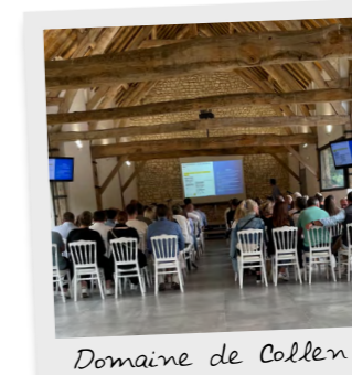
Domaine de Collen