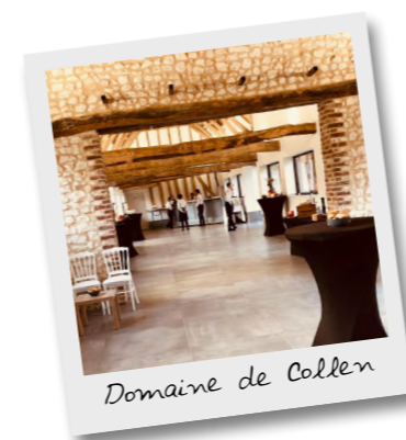
Domaine de Collen