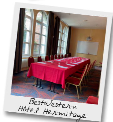
BestWestern Hôtel Hermitage